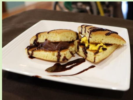
機能訓練と栄養科と介護課でどら 焼きレクが企画され、生地のお手伝 いや口腔体操などもしながら美味し くいただきました