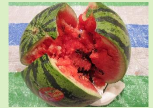
夏といえばスイカ割り！ 元気いっぱい！パカッと！ 気持ちよく割っていただきました