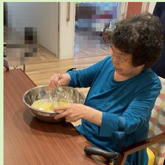
ご利用者様にもお手伝い いただきました